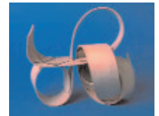
Foto * Compwood - Workshop * Universität für angewandte Kunst -Wien 1999 und 2001